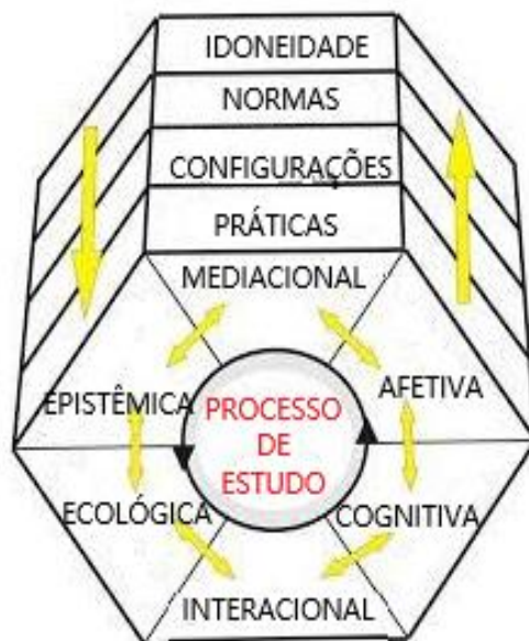
Figura 2 – Categorias do Conhecimento Didático-matemático do professor de Matemática