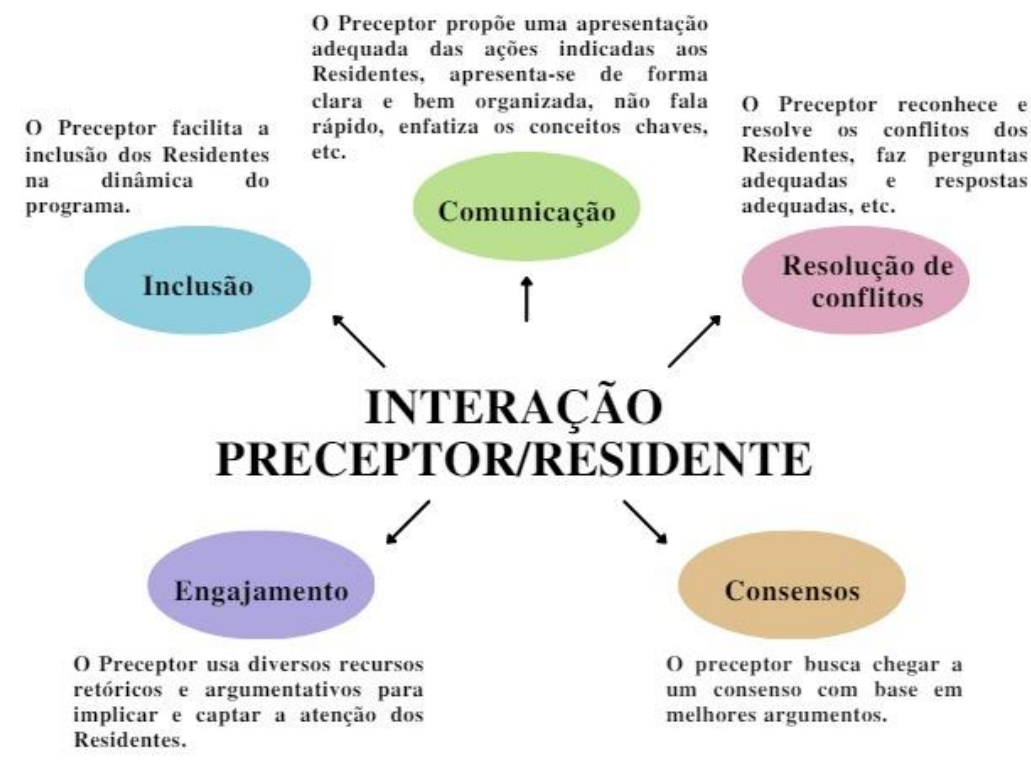
Figura 4 – Categorias da Interação Preceptor/Residente e seus indicadores