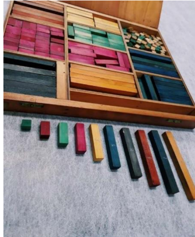
Figura 4: Material Cuisenaire