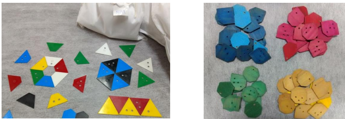
Figura 5: Peças do Jogo Trimath e do Quadrith