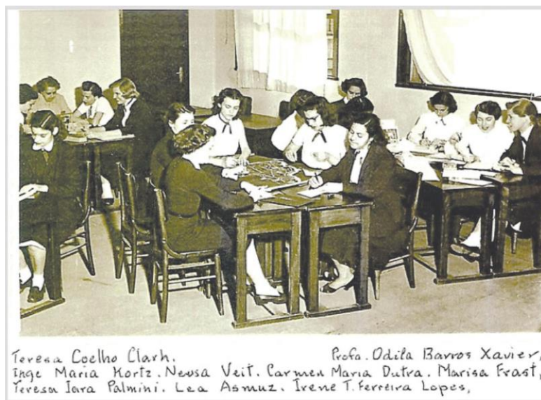
Figura 1 – Aula de Metodologia da Matemática